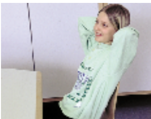
Beispiele für dynamisches oder bewegtes Sitzen