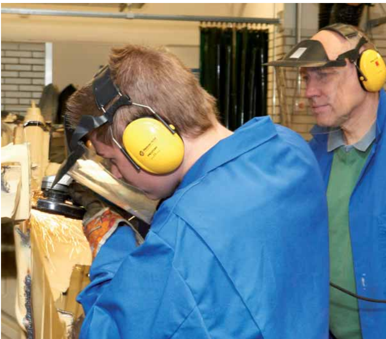
Arbeits- und Gesundheitsschutz in der Berufsschule ...

In speziellen Checklisten werden einzelne Orte (wie etwa Sportstätten, Technik, naturwissenschaftliche Räume, Aulen und Bühnen, Lehrküchen, Hauswirtschaft) oder einzelne Aspekte (wie beispielsweise Heben und Tragen, Infektionsgefährdung oder Mutterschutz) in den Fokus genommen.